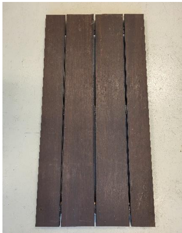
Figure 1: Picture of the received sample (example surface; length)